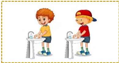
Erkek Öğrenci Lavabosu