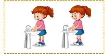
Kız Öğrenci Lavabosu